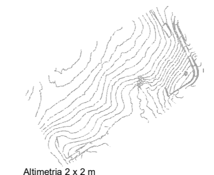
Altimetria 2 x 2 m